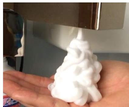
市販泡ソープ液使用例